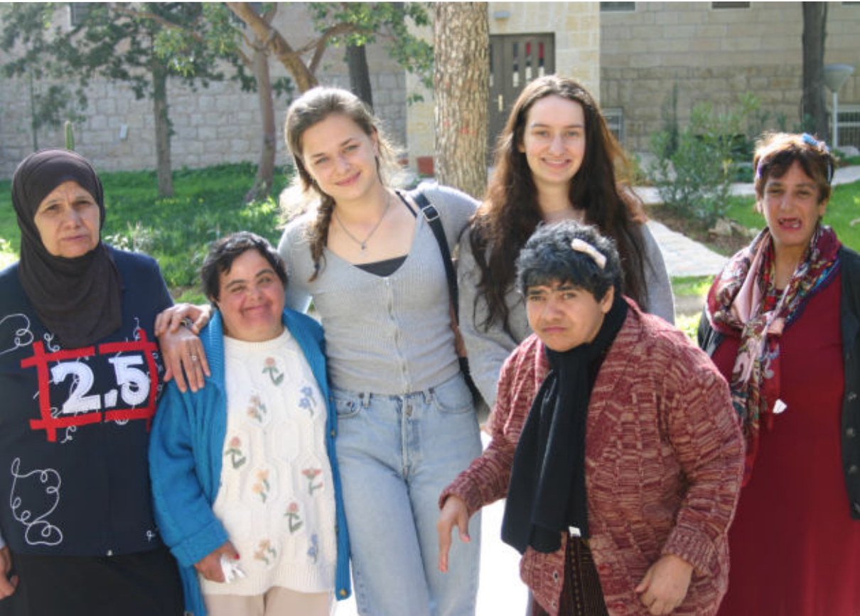
Foto: Bewohnerinnen und Volontärinnen sind im Garten unterwegs

ger Ort. Die Bäume tragen Früchte, im Garten gehen unsere Bewohnerinnen spazieren und genießen die Sonne, in der Pflegefakultät stehen die Studierenden nach der Vorlesung zusammen und diskutieren. Die Schwestern der Gründungsgeneration setzten sich zum Ziel: Wir wollen für die Armen da sein. Das gilt in gleicher Weise für heute. Mit einem Blick auf Entwicklungen der letzten fünf Jahrzehnte will ich beschreiben, welche Herausforderungen für Emmaus heute bestehen .