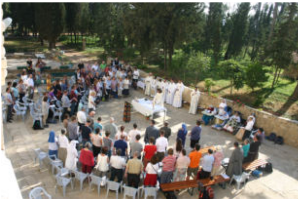
Foto: Ostermontag in Emmaus

Ebenso ist es mit dem Strom, für den wir seit dem letzten Jahr mit einem neuen Notstromaggregat die sichere Versorgung garantieren können. Irgendwo bei uns auf dem Gelände wird immer gebaut und repariert: Das zentrale Haus, die „Löwenburg“, in der die Pflegestation, die Küche, die Kapelle und die Verwaltung untergebracht sind, wurde zwei Mal grundlegend saniert und ausgebaut. Hinzu kommen kleine Umbaumaßnahmen: ein neuer Aufzug, ein neues Dach, ein Totenhaus, Gästezimmer, ein Vortragsraum für Pilgergruppen, die Steinmauern im Garten, immer ist etwas zu planen und zu tun. _____