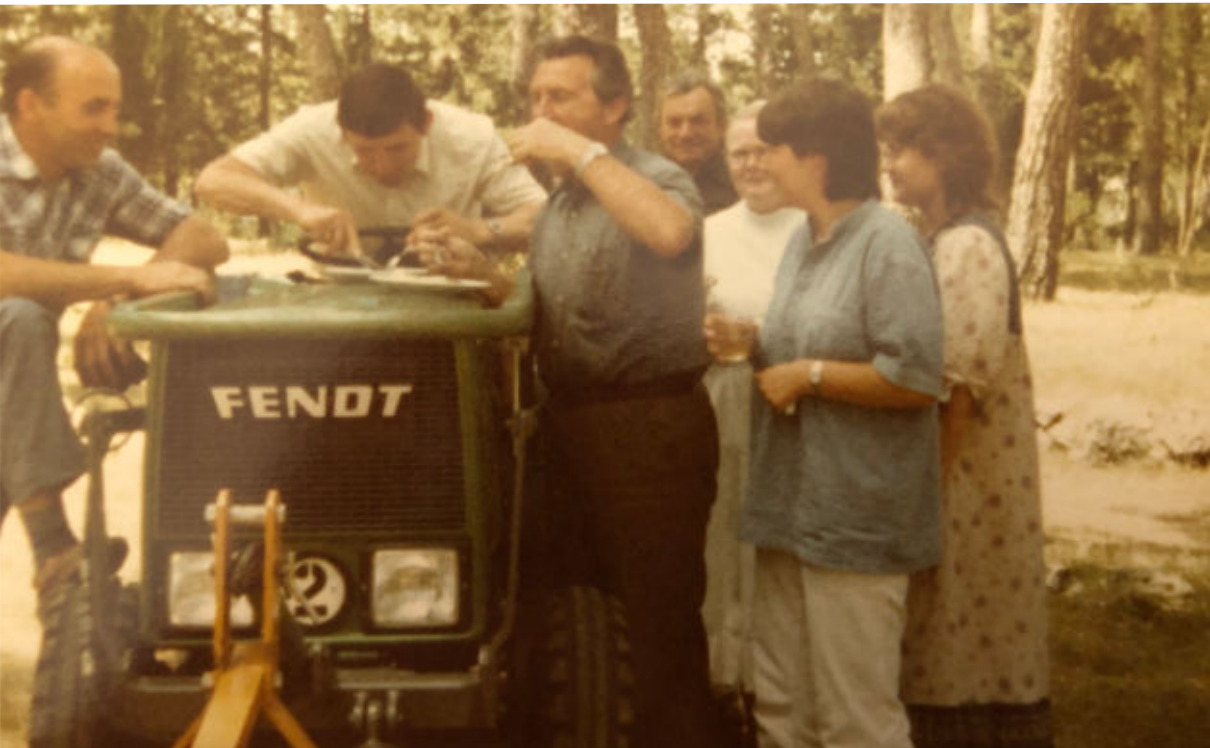
Foto: Der aus Deutschland angelieferte Traktor wurde im Jahr 1984 in Betrieb genommen.

wurde gebaut, die auch unseren Alltag in einem kleinen palästinensischen Dorf erheblich verändert hat. Der Weg nach Jerusalem, vormals eine halbe Stunde Fahrt mit dem Sammeltaxi, führt über Checkpoints und die Wartezeiten sind lang. Jede Pilgergruppe, die unser Haus besucht, melde ich im Vorfeld beim Militär an, damit diese den Checkpoint passieren darf. Nie ist planbar, ob das klappen wird. Im Vergleich mit der einheimischen Bevölkerung sind wir sogar privilegiert, denn immerhin ermöglichen unsere europäischen Pässe den Übertritt nach Israel. Unser Wirken in Emmaus war und ist ein Leben unter schwierigen politischen Bedingungen, das wir mit den Menschen in der Region solidarisch teilen .