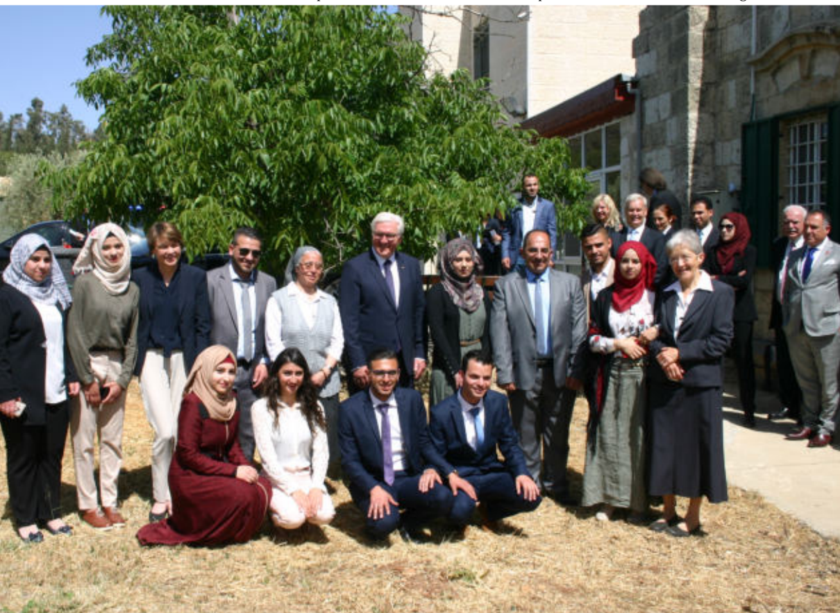
Foto: 2017 besuchte der deutsche Bundespräsident Steinmeier Emmaus. Er sprach mit Studierenden der Pflegefakultät.